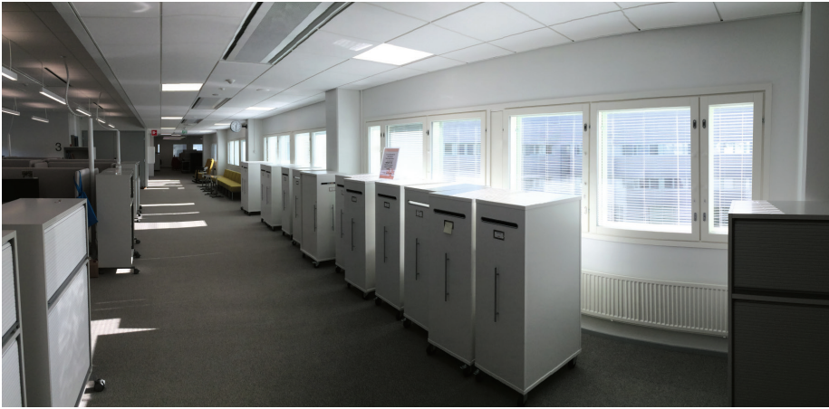
Kuva 9. Näkymä OAMK:n tiloista (17.9.2020).

Kesällä 2018 piti tuttu huone kuitenkin jättää, kun koko tiedekunta muutti Linnanmaalla niin sanotulle vanhalle puolelle. Aloitimme uusissa tiloissa syyslukukauden 2018 alusta. Humanistisen tiedekunnan tarpeisiin alkujaan tehty rakennus koki myös perusteellisen muutoksen ennen kuin ammattikorkeakoulu aloitti toimintansa siinä. Kuvassa yhdeksän on näkymä OAMK:n tiloista suurin piirtein samoilta jalan sijoilta kuin kuvassa TAIDAn käytävältä. Ensimmäiset kolme ikkunaa oikealla olivat elokuvatutkimus-oppiaineen huoneessa, seuraavat kolme taidehistorian. Ikkunoista on näkymä rakennuksen sisäpihalle.