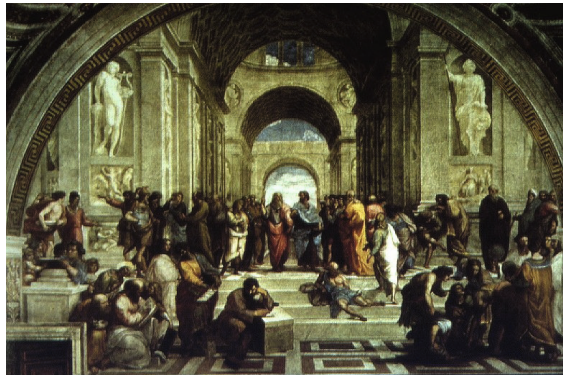
Kuva 2. Rafael, Ateenan koulu, 1509–11. Stanza della Segnatura, Vatikaani, Rooma. Kuva skannattu opetusdiasta kesällä 1999.

Miten saada opetuksen kuvat digitaalisiksi, kuvia kun oli satoja? Käytännössä se oli lopulta mahdollista vain skannaamalla olemassa olevat diat. Aloitin urakan kesällä 1999, jolloin työstin yleisen taidehistorian 56 tuntia pitkän luontosarjan kuvat. Diojen joukossa oli hyviä, tasokkaista kirjojen kuvista