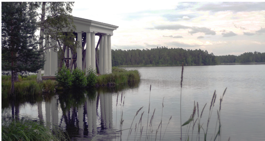
Kuva 4. C. L. Engel, Orisbergin kartanon kirkon kellotapuli, 1831. Isokyrö (22.7.2016).

li kannelluurein varustettuine pylväineen on puolestaan kuin antiikin Kreikan pieni doorilainen temppli (Kuva 4).