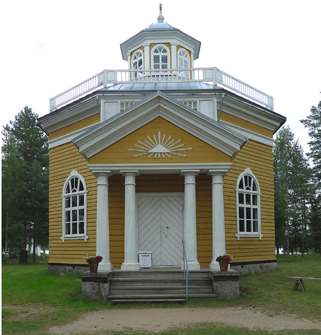
Kuva 3. C. L. Engel, Orisbergin kartanon kirkko, 1831. Isokyrö (22.7.2016).

Huonommin tunnettuna esimerkkinä Pantheonin vaikutuksesta voi mainita Engelin suunnitteleman Orisbergin kartanon kirkon Isossakyrössä vuodelta 1831 (Kuva 3). Kirkko jäljittelee tunnistettavalla tavalla Pantheonin hahmoa. Järven rannalle sijoitettu kellotapu-