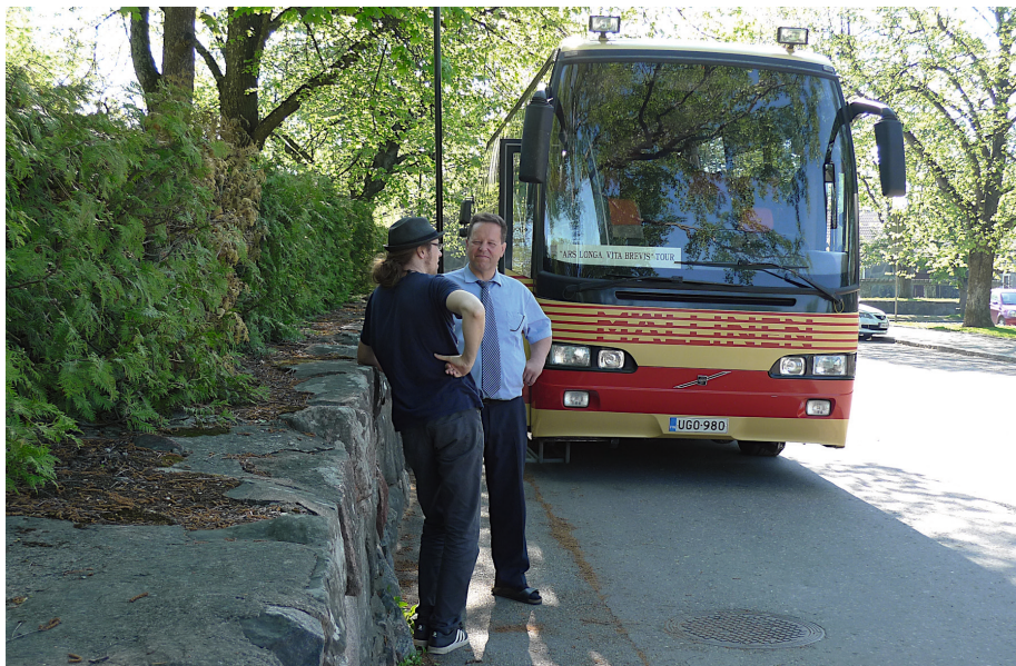
Kuva 7. Hitaasti kiiruhtaen Lohjan kirkolla (22.5.2014).

jossa lukee ”XXIX ARS LONGA VITA BREVIS TOUR”. Yksi tarina tuli seuraavana päivänä päätökseen.