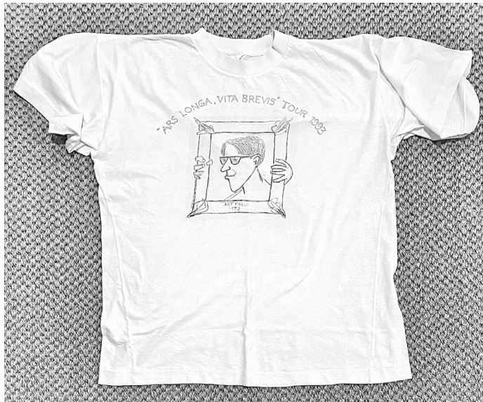
Kuva 6. Kotimaan ekskursiolla 1993 opiskelijoilta saamani T-paita.

Jossain vaiheessa rupesin numeroimaan matkoja. Keväällä 2022 tehtiin viimeinen kotimaan ekskursio. Koronaepidemia esti kaksi matkaa, kevään 2020 ja 2021. Viimeisellä kerralla sain juhllallisien menoin Turun linnassa muistoksi mukin,