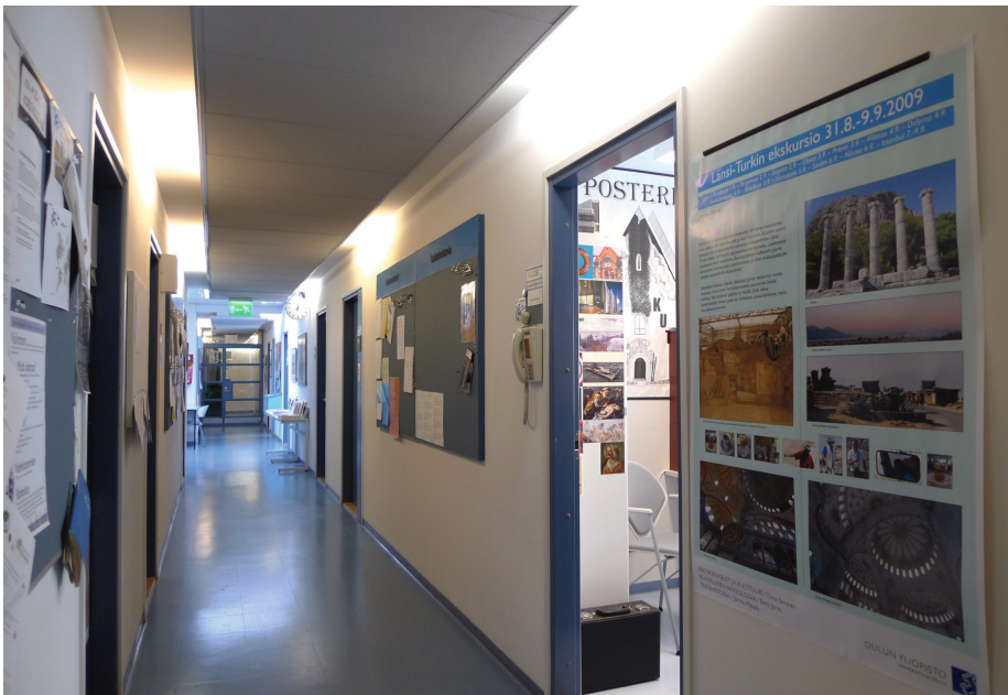
Kuva 8. Näkymä TAIDAn käytävältä historian laitoksen suuntaan (22.2.2018).

Edellä oli esillä, että HuTK ja KTK muuttivat Linnanmaalle alkuvuodesta 1993. Tuon jälkeen taidehistoria pysyi neljännesvuosisadan ajan samassa huoneessa HU336. Ensin laitos oli KKL, Kirjallisuuden ja kulttuuriantropologian laitos, mutta sai lyhenteen TAIDA arkeologia-oppiaineen siirryttyä historian laitokselta meidän puolellemme. Kuvassa kahdeksan on näkymä taideaineiden ja antropologian laitok-