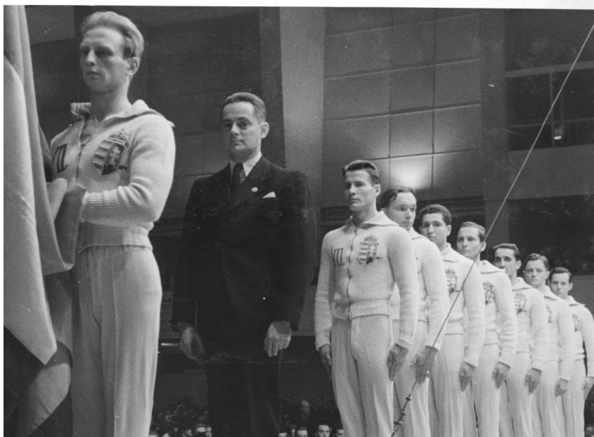
Kuva 1. Suomen ja Unkarin voimistelumaajoukkueet Helsingin Messuhallissa vuonna 1943.