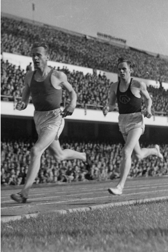
Kuva 2. Viljo Heinin ja Gunder Häggin kohtaaminen vuonna 1944. Kuvassa Heino johtaa juoksua, jonka Hägg lopulta vei nimiinsä.