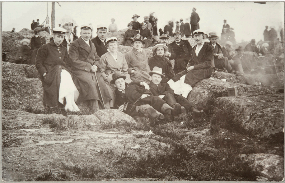
Kuva 2. Rautatievirkailijoita retkellä Ounasvaaralla vuonna 1913. Kallionkolossa sauhuaa kahvinuotio.

Kruununpuistoa Ounasvaarasta ei tullut, mutta siitä tuli yksi Suomen tunnetuimmista maisemakohteista. Kansallismaisemien valokuvaaja ja kirjailija I. K. Inha ei sisällyttänyt sitä vielä vuoden 1896 teokseensa Finland i Bilder , mutta vuonna 1909 julkaistussa Inhan teoksessa Suomen maisemia se oli jo mukana. 36 Maiseen kasvusta kertoo sekin, että juhannuksena 1917 Ounasvaaralla vieraili Suomen kenraalikuver-