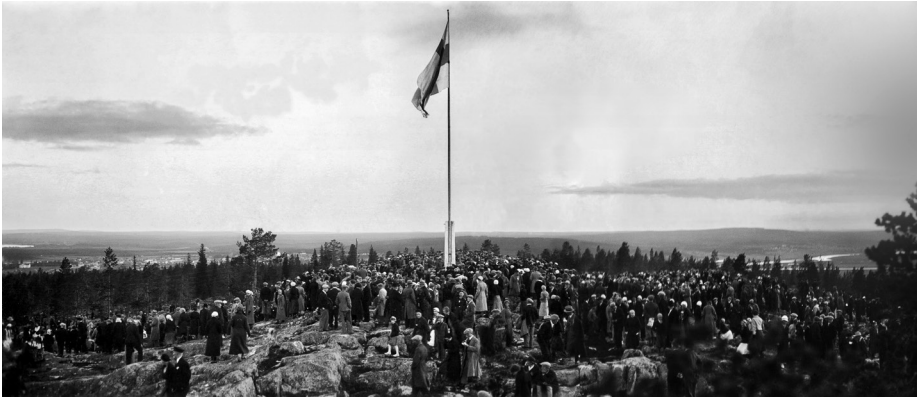
Kuva 3. Juhannusjuhlat ja Suomen lippu salossa Ounasvaaran laella vuonna 1935.