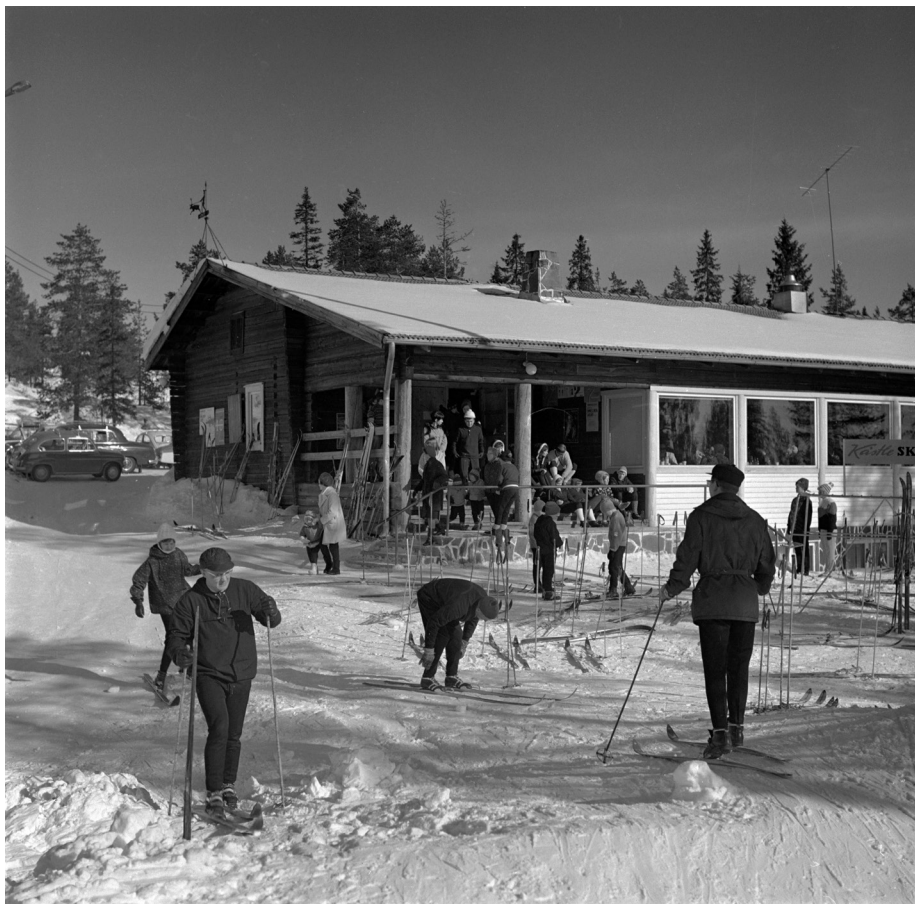
Kuva 5. Ounasvaaran Juhannuskallion juurelle vuonna 1949 valmistunut hiihtomaja laajennetussa asussaan 1960-luvun lopulla.

lähialueen tärkeimmäksi turistikohteeksi, oli Ounasvaarallakin edelleen oma merkityksensä matkailulle. 65