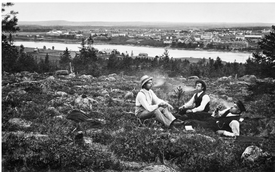
Kuva 1. Vapaa-ajan viettoä tupakanpolton merkeissä Ounasvaaralla 1910-luvun puolivälissä. Taustalla Kemijoki ja sen takana Rovaniemen kirkonkylää.

Kauempaa tulleille lapinmatkailijoille Ylitornion Aavasaksa oli pitkään tunnetumpi keskiyön auringon seuraamispaikka, ja se oli esillä jo 1800-luvun lopun ensimmäisissä kansallispuistopohdiskeluissa. 19 Aavasaksa sijaitsi kymmenkunta kilometriä Ounasvaaraa etelämpänä ja oli hieman korkeampi, mutta Ounasvaarakin tuli tunnetuksi laajalle yleisölle 1800-luvun puolivälistä alkaen sanomalehtien matkakuvausten kautta. 20 ”Ounasvaaralla kerrotaan ennen aikaan juhannusaattona wietetyn iloista elämää. Sinne kokoontui herrasväkeä ja rahvasta suuret joukot ja kauas näkyi sieltä loimuavat tulet.” 21