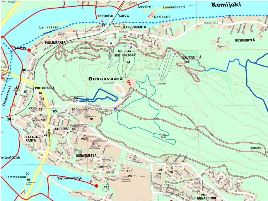
Kuva 9. Urheiluun ja matkailupalveluihin liittynyt rakentaminen sekä Rovaniemen kasvuun liittynyt asuntoalueiden ja julkinen rakentaminen etenivät 1900-luvun lopulla Ounasvaaran rinteillä, mutta lakialueella oli vuosituhaten vaihteessa vielä runsaasti rakentamattomaa luontoa. Opaskartta 2006. Rovaniemen karttapalvelu. Karttaa on rajattu Ounasvaaran alueeseen.

Ounasvaaran kehittämisproblematiikkaan vaikutti osaltaan kaupungin ja maalaiskunnan yhdistyminen vuoden 2006 alusta. Julkista keskustelua kiihdytti myös Lapland Hotelsin tekemä kaavamuuosesitys, joka olisi mahdollistanut noin 150–200 majoitusyksikön eli noin 50–75 uuden paritalon rakentamisen hotellin tuntumaan olemassa olleiden parinkymmenen mökin lisäksi. Hankkeen vastustus synnytti Pro Ounasvaara -liikkeen ja jälleen uuden kansalaisadressin puolustamaan lakialueen luontoa. Kaupunginhallitukselle jätettiin toisaalta myös rakentamishanketta kannattanut adressi. Kaupunginhallitus jätti asian tiukan äänestyksen jälkeen pöydälle. 109