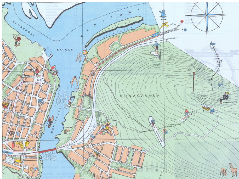
Kuva 6. Ounasvaara oli 1950-luvun puolivälissä vielä suurimmalta osalta rakentamatonta luonnonaluetta. Rovaniemi. Matkailukartta. Tehty Rovaniemen kauppalan mittaustoimistossa v. 1955. Rovaniemen karttapalvelu. Karttaa on rajattu Ounasvaaran alueeseen.

to.” Vuopala suositteli ”biologisesteettistä” metsänhoitoa, joka olisi pitänyt sisältää eri alueilla eri tavoin toteutettavia harvennuksia, uudistushakkuita ja kuolleiden ja kaatuneiden puiden poistoa mutta myös luonnonmukaisia metsikköjä. Ajatuksena oli biologisesti terveen ja maisemallisesti vaihtelevan ”kulttuurimetsän” luominen. ”Kuntourheiluparatiisiin” piti luoda myös kunnolliset polut ja latupohjat sekä maisemallisesti arvokkaihin paikkoihin levähdyspenkit. Noin 50 ha:n aarnialue olisi voitu jättää täysin luonnontilaan. Puistometsäsuunnitelmaa hyödynnettiin jatkossa kaupungin metsätaloussuunnittelussa, vaikka varsinaisia suojelupäätöksiä ei tehtykään. 74