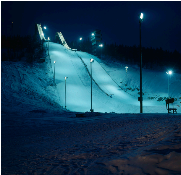
Kuva 8. Ounasvaaran hyppyrimäet iltavalaistuksessa 1980-luvulla.

Vuonna 1989 vahvistetussa Lapin seutukaavassa oli Ounasvaaralle jälleen osoitettu virkistys- ja suojelualuevarauksia. Samana vuonna vahvistetussa Ounasvaaran osayleiskaavassa liikuntarakentaminen oli keskitetty vaaran länsipäähän ja itään