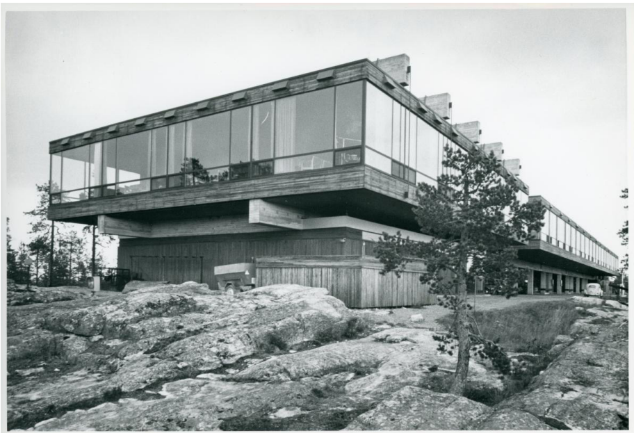
Kuva 7. Juhannuskallion päälle vuonna 1968 valmistunut Hotelli Ounasvaara. Kuva todennäköisesti vuodelta 1970.

kompromissi rovaniemeläisiä palvelevan ja osin suojellun kunnallispuiston ja toisaalta kilpaurheilun ja matkailun tarpeiden välillä. Suunnitelmat eivät toteutuneet sellaisinaan, mutta rakentaminen eteni pienimuotoisesti myös lakialueella ja kilpaurheilu sai uusia suorituspaikkoja pohjoispuolelle. Hiihtomaja, valaistu latu ja retkeilypolut palvelivat kunnallispuistoajatusta, mutta hotellin sijoitus Juhannuskallion alueelle aiheutti jo kotiseutu- ja luontoihmisten taholta hyvin suoraa kritiikkiä. Myös muualla lähiluonnon puolesta puhujia olivat luonnonsuojeluyhdistysten ohella usein kotiseutuyhdistykset 88 . Luonnonsuojeluaatteen kansallinen nousukausi näkyi myös Ounasvaarasta käydyssä keskustelussa.